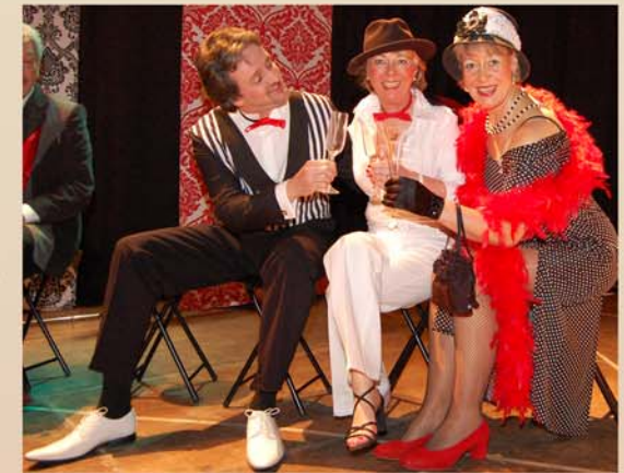
Revue 2009: Gleich geht der Vorhang auf

„Du, Schatz, sollen wir am Sonntag nicht mal wieder in die Sauna gehen?“ – „Nein, ich habe Chorprobe.“ – „Ist schon klar, Chor geht vor.“ Überlieferter Dialog aus dem Haus eines Chormitglieds