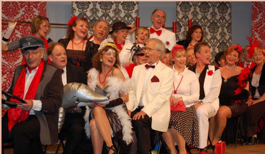
Revue „Herzklopfen“ 2009: Italien-Medley