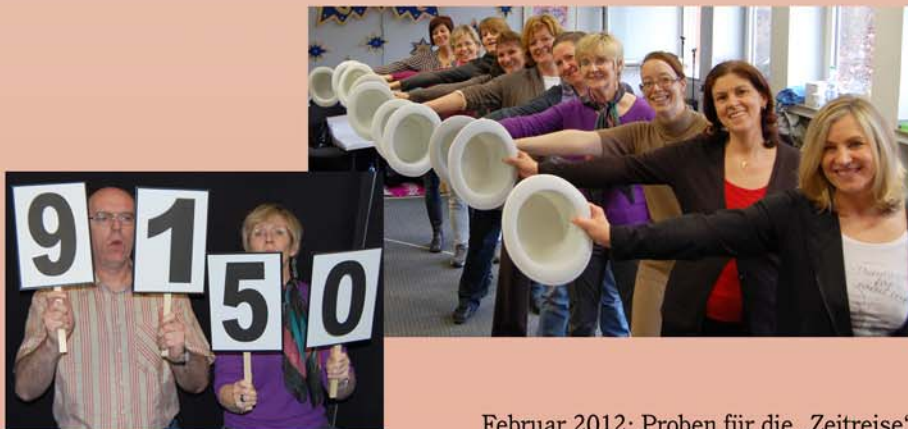
Februar 2012: Proben für die „Zeitreise“

Musik: Sholun Secunda ~ Text: Jacob Jacobs ~ Chorsatz: Carsten Schlagowski